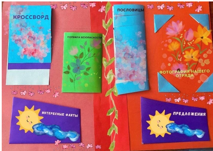
Рисунок 2 – Разворот лэпбука.

2. Теперь приступим к созданию кармашков для лепбука.